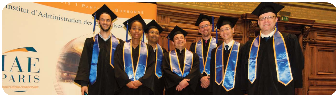
Diplômés 2014 de l'International MBA